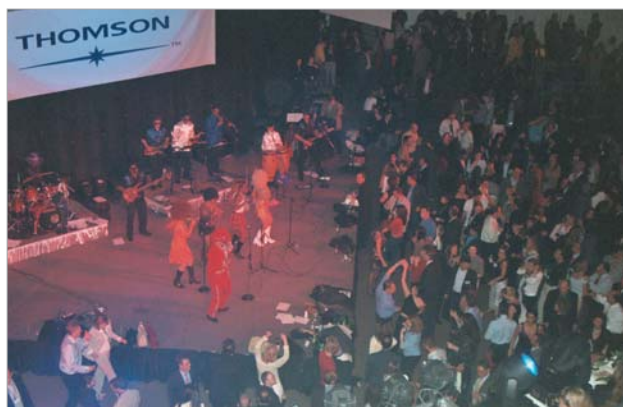
De gasten op de Compu-Mark party genoten tot ver na middernacht van de mystieke sfeer en de swingende muziek

De jaarlijkse conferentie van de International Trademark Association (INTA) had dit jaar plaats in Atlanta. Van 1 tot 5 mei 2004 verzamelden meer dan 6000 merkenspecialisten uit de hele wereld in en rond de Hyatt Regency en Marriott Marquis hotels in het hart van de stad, om deel te nemen aan de grootste conferentie in de merkenwereld.