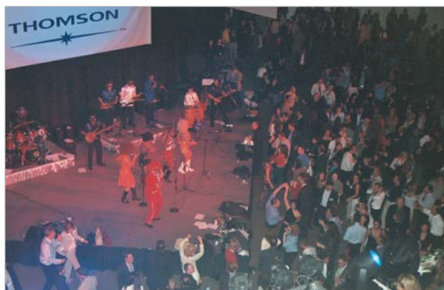
Les invités à la soirée de Compu-Mark ont apprécié jusqu'aux petites heures l'ambiance mystique et la musique entraînante

La conférence annuelle de l'International Trademark Association (INTA) se tenait cette année à Atlanta. Du 1er au 5 mai 2004, plus de 6000 spécialistes des marques du monde entier se sont rassemblés au cœur de la ville, dans les hôtels Hyatt Regency et Marriott Marquis et aux alentours, pour participer à la plus grande conférence du monde des marques.