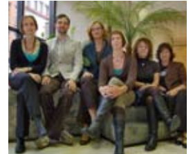
Het Third Parties Team

"Thomson CompuMark heeft een uitgebreid netwerk van 250 geselecteerde partners in meer dan 200 landen. Een team van 6 specialisten waakt constant over de kwaliteit."