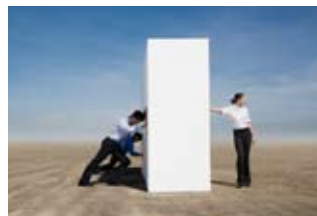
STRUMENTO DI ANALISI: OTTENERE DI PIÙ CON MENO SFORZO

Per entrare nello strumento di analisi, andate nel sito compumark.thomson.com , inserite il vostro nome utente e password e scegliete Inbox. Cliccate sul nome della ricerca di vostro interesse per aprirne il risultato nello strumento di analisi.